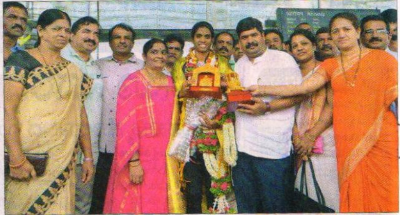
ಎಂ.ಆರ್. ಪೂವಮ್ಮ ಅವರನ್ನು ಗುರುವಾರ ಮಂಗಳೂರು ವಿಮಾನ ನಿಲ್ದಾಣದಲ್ಲಿ ಸ್ವಾಗತಿಸಲಾಯಿತು.

ತವರಿನ ಸ್ವಾಗತಕ್ಕೆ ತುಂಬಾ ಮುಷಿಯಾಗುತ್ತಿದೆ. 2014ರಲ್ಲಿಯೂ ಇದೇ ರೀತಿಯಾದ ಸ್ವಾಗತ ದೊರಕಿತ್ತು. ಮುಂದಿನ ವರ್ಷ ಏಷ್ಯನ್ ಚಾಂಪಿಯನ್‌ಷಿಪ್ ಮತ್ತು ವಿಶ್ವ ಚಾಂಪಿಯನ್‌ಷಿಪ್‌ಗೆ ತಯಾರಿ ಆಗಬೇಕಾಗಿದೆ. ತರಬೇತಿ ಶಿಬಿರ ಮುಂದಿನ ಆಕ್ಟೋಬರ್‌ನಲ್ಲಿ ನಿರ್ಧಾರವಾಗಲಿದೆ. 2020ರಲ್ಲಿ ಒಲಿಂಪಿಕ್‌ನಲ್ಲೂ ಭಾಗವಹಿಸುವ ಇರಾಧೆ ಇದೆ. ಅದಕ್ಕಾಗಿ ಮುಂದಿನ